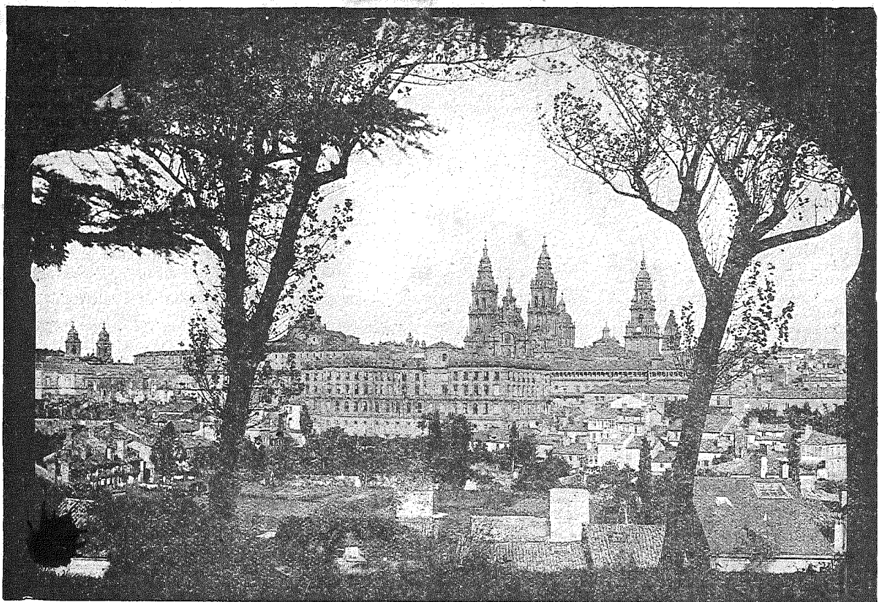
SANTIAGO.—ARTISTICA PERSPECTIVA DE LA CIUDAD