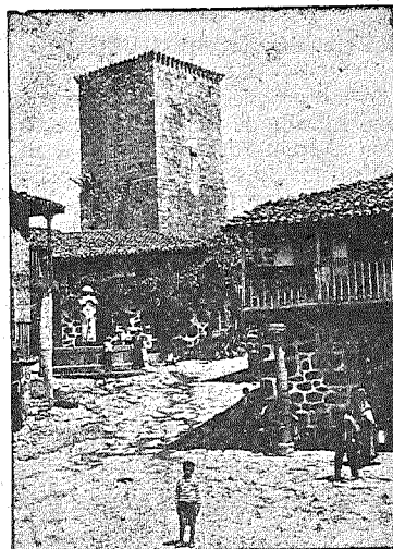
TIPICO RINCON ALDEANO